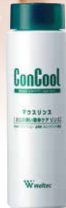
すすぐ 液体タイプ